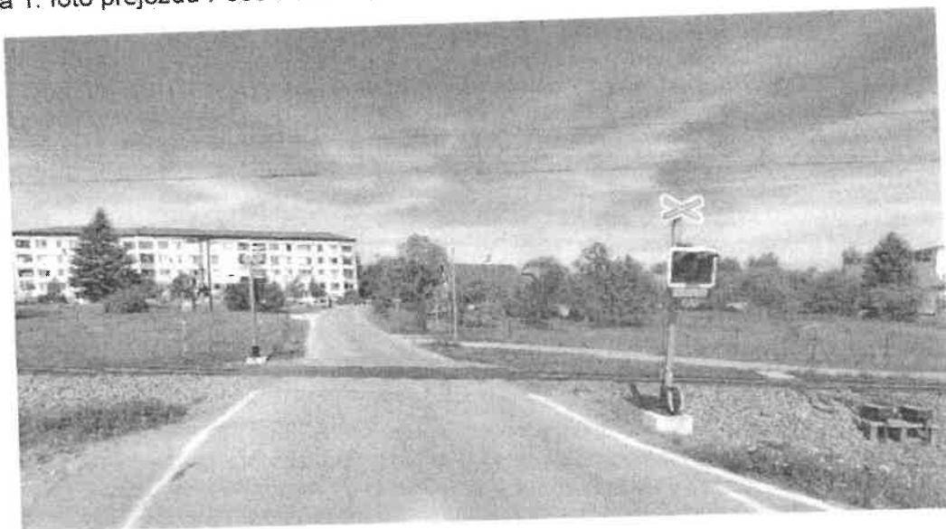
Příloha 2: foto přejezdu P6655 v km 4,569 – vlevo Zábřeh na Moravě, vpravo Šumperk